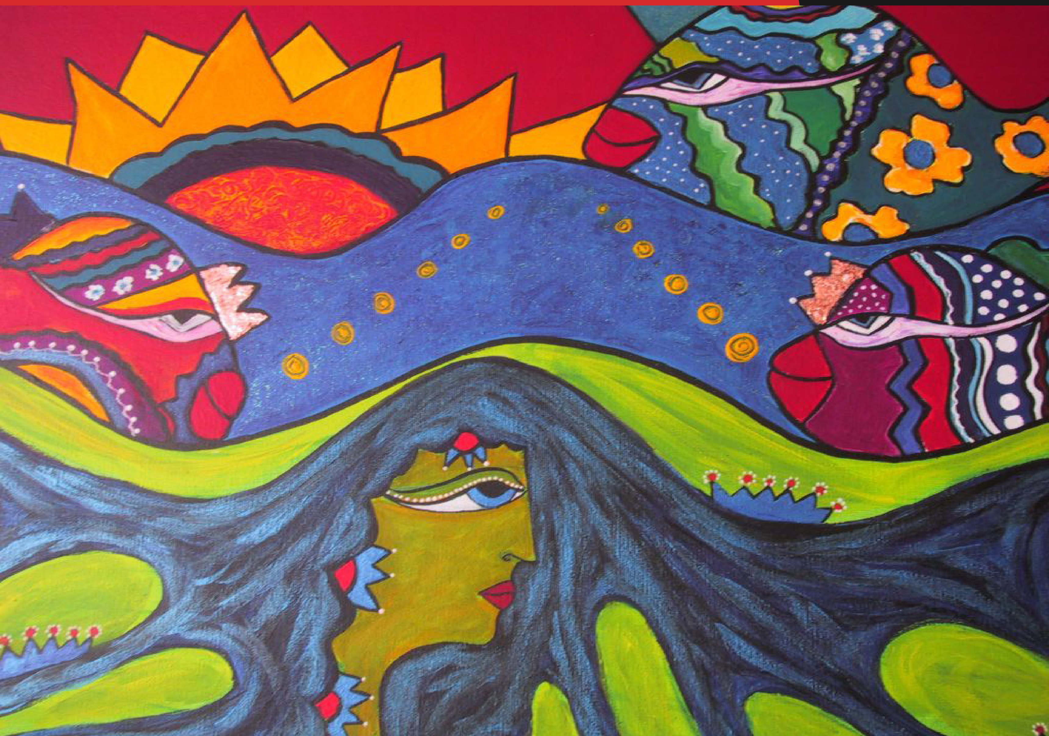
Sol en el mar, Aurea Gonzalez