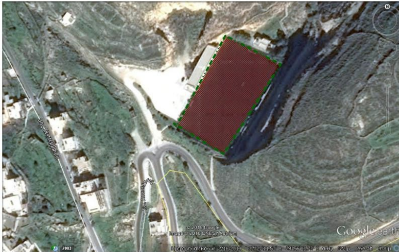
ΧΩΡΟΣ ΚΑΤΑΦΥΓΗΣ - ΚΑΤΑΥΛΙΣΜΟΥ: ΓΗΠΕΔΟ ΑΝΩ ΣΥΡΟΥ